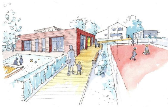
Entwurf Kinderkrippe Niedervellmar